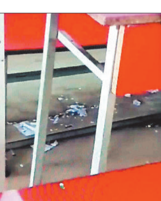
वलास में बीखरे कचरा।