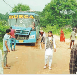
हरिभूमि न्यूज ▶▶ प्रतापपुर

विकासखंड प्रतापपुर अंतर्गत चंदेरा से चिकनी जजावल जाने वाली सड़क की स्थिति बदलाव हो गई है। सड़क पर जगह जगह बड़े-बड़े गड्ढे अब हादसे को न्योता दे रहे हैं। आज उस समय एक बड़ी दुर्घटना टल गई जब यात्रियों से खचाखच भरी यात्री बस पलटने से बाल-बाल बच गई।