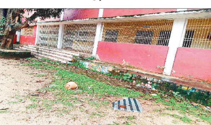
स्कूल परिसर में फैले कचरा।

शिक्षा को बढ़ावा देने प्रदेश सरकार द्वारा विभिन्न योजनाएं संचालित की जा रही है जिससे बच्चों को बेहतर शिक्षा मिले। प्रदेश सरकार द्वारा निजी स्कूल की तरह न सिर्फ व्यवस्था हो बल्कि शिक्षा गुणवत्ता में सुधार आए इसके लिए स्वामी आत्मानंद स्कूल का संचालन किया जा रहा है। नगर पंचायत प्रतापपुर में शासन की उत्कृष्ट विद्यालय स्वामी आत्मानंद इंग्लिश मीडियम स्कूल संचालित है लेकिन स्कूल प्रबंधन की लापरवाही तथा देख रेख के अभाव में स्कूल परिसर कूड़ा कचरे के तब्दील हो गया है। यहां तक की साफ सफाई के अभाव में स्कूल परिसर में जगह जगह कचरा है वहीं कक्षाओं में भी सफाई के अभाव में कचरा बिखरे हुए है। हैरानी